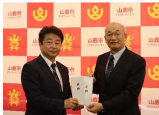
①11月24日/熊本県山鹿市