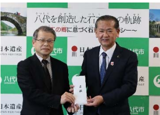
④2月14日/熊本県八代市