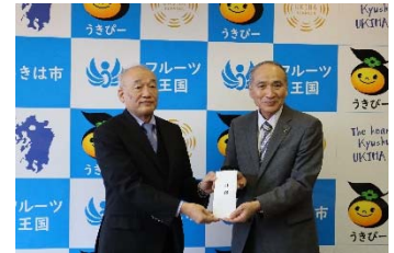
③2月7日/福岡県うきは市