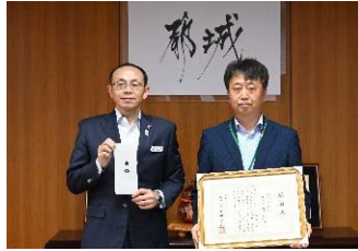
②7月20日/宮崎県都城市