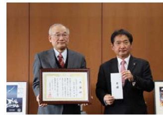
②1月23日/福岡県久留米市