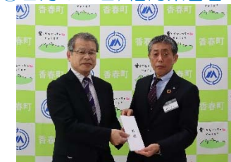
⑤2月17日/福岡県香春町